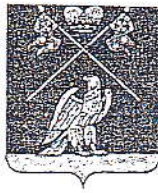
Рис. 403 Давыдова М.М. Мамбеевой Е.В. h